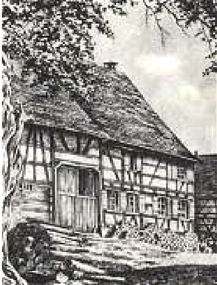
Gaienhofen am Bodensee