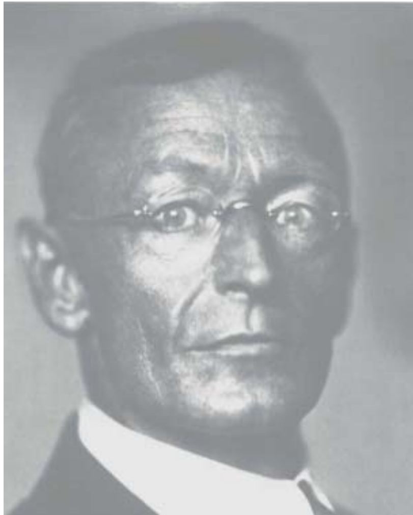
Hermann Hesse 50jährig

Hermann Hesse – Dichter einer anderen Welt. Wer seine Bücher gelesen hat, kann dem wahrscheinlich zustimmen. Ich persönlich bin jedenfalls beim Lesen so tief in diese Geschichten versunken und habe so stark mitgelebt, dass ich alles um mich vergessen habe. Im Laufe der Zeit habe ich etwa zehn seiner Bücher gelesen und von allen ist für mich eine magische Anziehung ausgegangen. Das hat bei mir bald einmal ein Interesse für Hermann Hesse hervorgerufen, für den Mann, der solche traumhafte Bücher schrieb, die so viel über das Leben aussagen. Bei diesen Nachforschungen bin ich auf ein Zitat von Hermann Hesse gestossen: