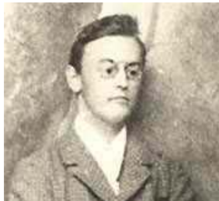
16 Jahre alt

Auf seinen Wunsch hin besucht er nach seiner Entlassung aus der Nervenheilanstalt das einjährige Gymnasium in Cannstatt. Doch schon bald schlägt auch dieser Versuch fehl. Im Oktober 1893, als Sechszehnjähriger, wird mit der Buchhandlung Mayer in Esslingen ein Lehrvertrag abgeschlossen. Aber bereits nach drei Tagen entläuft der neue Lehrling. „Dass ich ohne weiteres immer weggelaufen bin“, schreibt Hesse an seinen Vater „galt Euch für krankhaft. Es war natürlich nicht das Richtige, aber ich fühlte zu allem, was Ihr aus mir machen wolltet, keine Lust, keine Kraft, keinen Mut. Wenn ich so ohne jedes Interesse an meiner Arbeit Stunde um Stunde im Geschäft oder Studium war, ergriff mich eben Ekel. Meine freien Stunden habe ich immer zur Privatausbildung verwendet, Ihr nanntet es brotlose Künste, ich aber hoffte und hoffe davon zu leben.“ 12