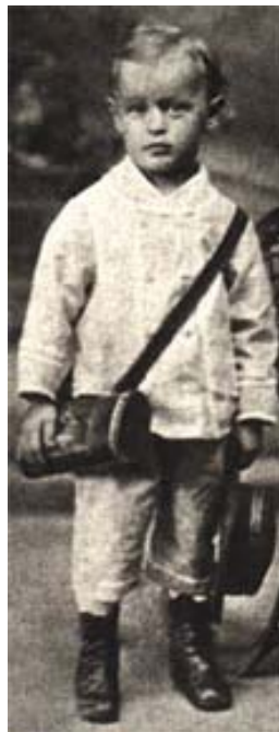
3 Jahre alt

Die Ansichten der Eltern prallen schon früh auf das Wesen von Hermann Hesse. Mit lebhaftem Temperament und grosser Sensibilität begabt, war Hesse bei Pflanzen und Tieren nicht minder zu Hause als im Dickicht seiner Träume und seiner Phantasie. Das unglaublich lebhaft und verwegene Wesen ist nur die eine Seite. Bald werden auch Trotz und Eigensinn hervorgehoben. So schreibt seine Mutter über den eineinhalbjährigen Hesse: „Hermann hat die Mägde nach Kräften tyrannisiert und in allem seinen Willen durchgesetzt. Ich habe ihn nun in spezielle Zucht genommen.... Von der Rute hat er nun doch endlich einen heilsamen Respekt bekommen. Nie hätte ich es für möglich gehalten, dass ein eineinhalbjähriges Bürschchen schon so ungeheure Kraft, Energie, Waghalsigkeit und doch zugleich soviel Liebenswürdigkeit entwickeln könnte.“ 3 Lassen wir dazu auch noch Hesse zu Wort kommen: „Ich war das Kind frommer Eltern, welche ich zärtlich liebte und noch zärtlicher geliebt hätte, wenn man mich nicht schon frühzeitig mit dem vierten Gebote vertraut gemacht hätte. Gebote aber haben leider stets eine fatale Wirkung auf mich gehabt, mochten sie noch so richtig und noch so gut gemeint sind... Ich braucht nur das „Du sollst“ zu hören, so wendete sich alles in mir um und ich wurde verstockt.“ 4