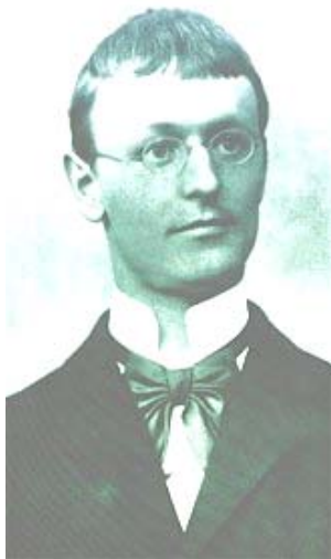
21 Jahre alt

Nach Abschluss der Lehre arbeitet der nun 21jährige Hesse als Buchhandlungsgehilfe noch ein Jahr in Tübingen. Nun hält in die Welt der Romantiker gefangen. Er beschäftigt sich mit Novalis, Tieck, Eichendorff, Brentano, Schleiermacher und Schlegel. 1898 erscheint sein erster Band „Romantische Lieder“, für dessen Druck er selber aufkommen muss. Ein Jahr später folgt „Eine Stunde hinter Mitternacht“, für das ihn Rainer Maria Rilke lobt.