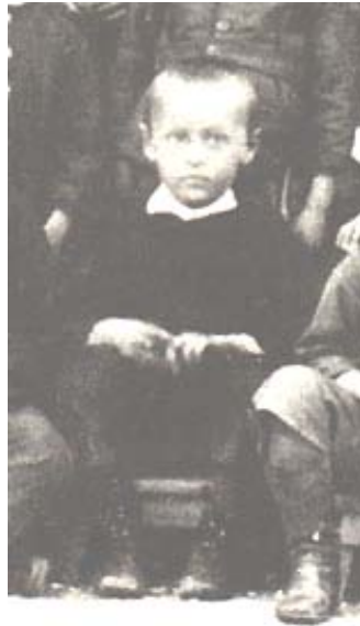
Im Kindergarten des Basler Missionshauses, 4 Jahre alt

1881 zieht Hesse mit seinen Eltern nach Basel, wo sein Vater als Herausgeber eines Missionsmagazins arbeitet. Das Kind Hesse verlebt hier glückliche Jahre. „Als Urerlebnis gehört zu dieser Zeit die weite Wiese hinter dem Haus mit all ihren unzähligen Einzelheiten und Geheimnissen, und es gehören dazu die Erzählungen der Mutter...“ 5 In diesen Jahren beginnt für Hesse aber auch die Schulzeit mit strengen Lehrern, die nicht mit Strafen und Schlägen zurückhalten. Er verliert das Vertrauen gegenüber den Eltern, die ihn nicht vor der Übermacht der Lehrer schützen können.