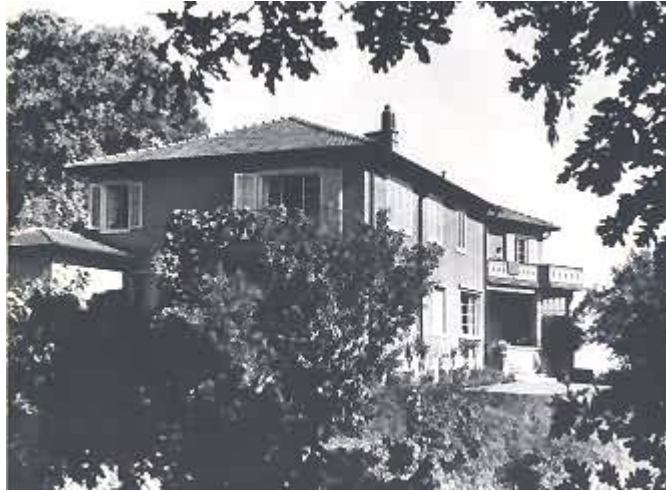
Die „Casa rossa“, die 1931 fertiggestellt wurde.

Hesse lebt weiterhin in Montagnola, seit 1931 aber in einem eigenen, neuen Haus, der „Casa rossa“, das ihm von einem Gönner auf Lebenszeiten zur Verfügung gestellt wird.