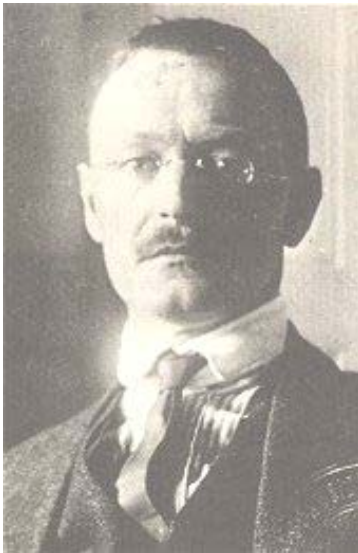
Passbild im Ersten Weltkrieg

Vom Kriegsausbruch bis 1919 ist er in der „Deutschen Gefangenenfürsorge Bern“ tätig. Seine Erfahrungen mit dem Krieg beschreibt er als seine „zweite Wandlung“: „Man erinnere sich: die erste Wandlung war eingetreten in dem Augenblick, wo mir der Entschluss bewusst wurde, ein Dichter zu werden. Der vorherige Musterschüler Hesse wurde von da an ein schlechter Schüler, er wurde bestraft, er wurde hinausgeworfen, er tat nirgends gut, machte sich und seinen Eltern Sorge um Sorge – alles nur, weil er zwischen der Welt, wie sie nun einmal ist oder zu sein scheint, und der Stimme seines eigenen Herzens keine Möglichkeit einer Versöhnung sah. Dies wiederholte sich jetzt, in den Kriegsjahren, aufs neue. Wieder sah ich mich im Konflikt mit einer Welt, mit der ich bisher in gutem Frieden gelebt hatte.“ 21