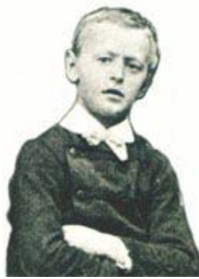
12 Jahre alt

Doch mit 13 Jahren beginnen seine inneren Kämpfe. Seit diesem Zeitpunkt weiss er nämlich, dass er „entweder Dichter oder gar nichts“ 8 werden wollte. Sein Verhalten lässt so zu wünschen übrig, dass in die Eltern in die Lateinschule einer anderen Stadt „in die Verbannung“ 9 schicken.