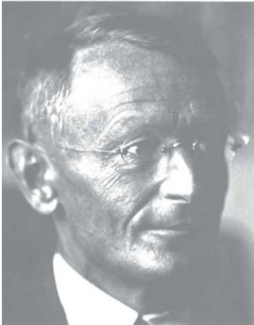
Hermann Hesse 50jährig