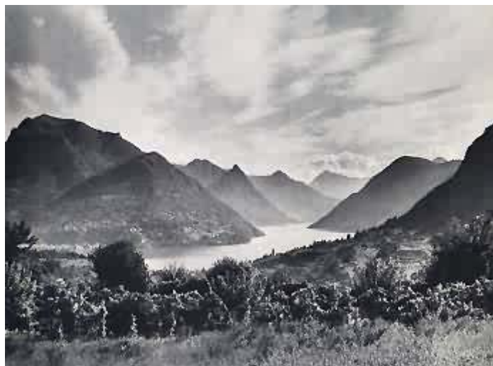
Blick von Montagnola auf den Luganer See

„Ich konnte nach dem Krieg und den paar in Amtsarbeit verlorenen Jahren nicht wieder da anfangen, wo ich aufgehört hatte. Inzwischen war Krieg gewesen, war mein Frieden, meine Gesundheit, meine Familie zum Teufel gegangen, ich hatte die ganze Welt aus neuen Gesichtspunkten sehen gelernt und namentlich meine Psychologie durch das Miterleben der Zeit und durch die Psychoanalyse völlig neu orientiert. Es blieb mir nichts übrig, wenn ich überhaupt weitermachen wollte, als unter meine früheren Sachen einen Strich zu machen und neu zu beginnen.“ 25