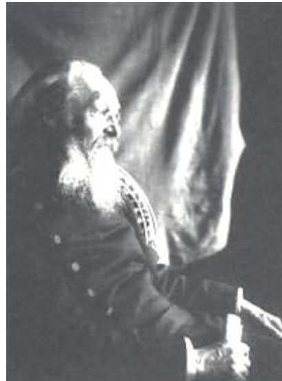
Hesses Vater 1916