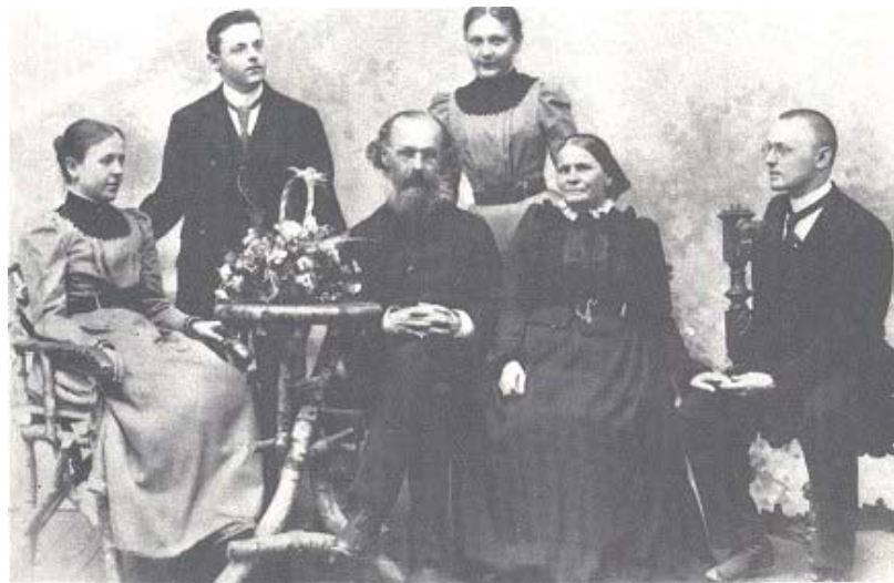
Hesse (rechts) 1899 mit seiner Familie

Nach dem Abschied von Tübingen im August 1899 zieht es Hesse nach Basel, in die Stadt alter Geschichte und hoher Kultur. Es gelingt ihm, eine Anstellung in der Buchhandlung Reich zu finden, die er 1901 als 24jähriger mit einer Anstellung in einem Antiquariatsladen vertauscht. Zu jener Zeit unternimmt Hesse mehrere Reisen vor allem in der Schweiz und 1901 nach Italien. Die abendlichen Stunden gehören weiterhin der Literatur und dem eigenen Schreiben und Dichten. Kleinere Aufsätze, Gedichte und Rezensionen werden da und dort veröffentlicht. Hesse wird sich seiner Selbst sicherer. Sein eigenes Bewusstsein klärt sich, und er schreibt einem seiner Kollegen: „Wir haben unser Ziel gefunden, mit heissen Opfern. Du weisst, ich bin hier in Basel in einem Antiquariat und verkaufe alte, kostbare Bücher. Aber ich bin daran, neue zu schreiben, die noch keiner geschrieben hat.“ 14