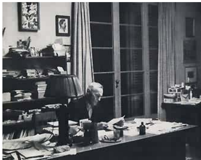
Hesse am Schreibtisch (1952)

Nichtsdestotrotz beantwortet er alle Briefe von Leserinnen und Lesern, die mit ihren Problemen an ihn gelangen, selber. In seinem ganzen Leben sind es mindestens 35tausend. „Auch heute stellt jeder Tag an mich die Forderung, mich der Welt anzupassen und, wie die meisten es tun, mich all der aktuellen Aufgaben mit Hilfe von Routine und Mechanisierung zu entledigen, mit Hilfe eines Apparats, einer Sekretärin, einer Methode. Vielleicht sollte ich die Zähne zusammenbeißen und es noch auf meine alten Tage erlernen? Aber nein, es wäre mir nicht geheuer dabei, und alle jene vielen, deren Nöte ihre Wellen bis auf meinen überhäuften Schreibtisch spült, wenden sich ja an einen Menschen, nicht an einen Apparat.“ 34