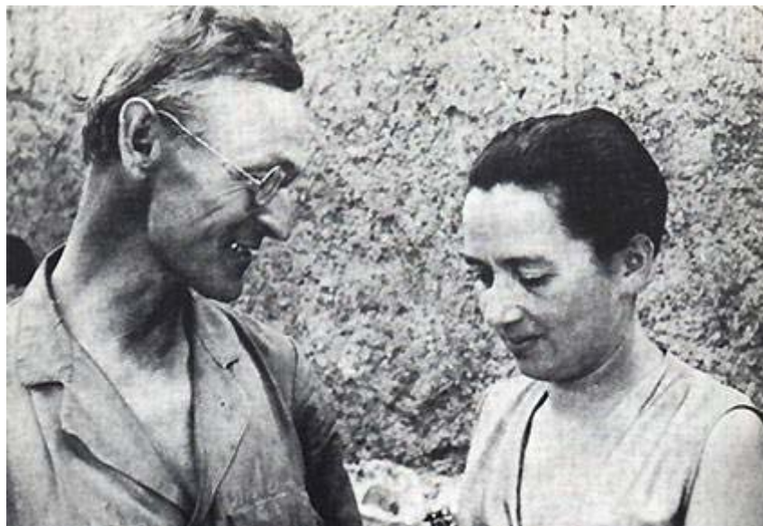
Hermann mit seiner dritten Frau Ninon Dolbin

Ebenfalls in diesem Jahr heiratet er die 36jährige Ninon Dolbin, eine energische Frau, deren Liebe und Verständnis sie befähigten, ihm bis ans Lebensende die ideale Lebenspartnerin zu sein.