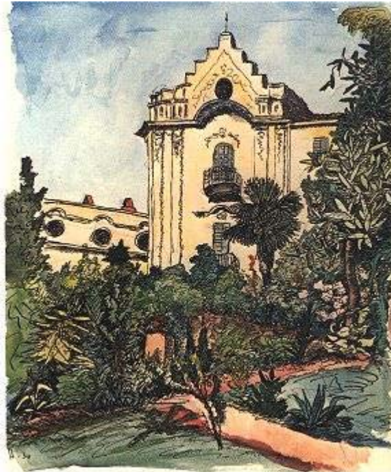
Aquarelle von Hesse der Casa Camuzzi, in der er nach 1919 lebte

Mitte des Ersten Weltkrieges hat Hesse mit dem Malen begonnen. In seinem ganzen Leben entstanden viele Hunderte von Aquarellen, die nach autodidaktischen Anfängen mit gedämpften Tönen seit der Übersiedlung in die farbenfrohe Landschaft des Tessins expressionistisch werden. Zu seiner neuen Freude schreibt Hesse: „Aber das Malen ist wunderschön, es macht einen froher und duldsamer. Man hat nachher nicht wie beim Schreiben schwarze Finger, sondern rote und blaue.“ 27